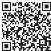
尊享服务 专属权益

请使用微信扫描关注以上二维码。 扫描“尊享服务”上方的二维码进入公众号,点击绑定设备 后可查看产品视频和用户指南。